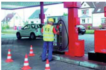
Als Fachfirma für die technische Betreuung und Spezialist für Reparaturen an Autogasfüllanlagen hat sich Schröder Gas in Nord-, Mittel- und Ostdeutschland einen Namen gemacht.

Das Familienunternehmen Schröder Gas ist der überregionale Energieversorger und Servicedienstleister für Haushalt und Gewerbe. Neben der Installation und Wartung von Flüssiggasanlagen im Haushaltsbereich bietet Schröder Gas auch Dienstleistungen im Bereich von gewerblichen und industriellen Flüssiggasanlagen an, sowie Wartung und Prüfungs koordinierung von Autogastankstellen und Flüssiggasfüllanlagen.